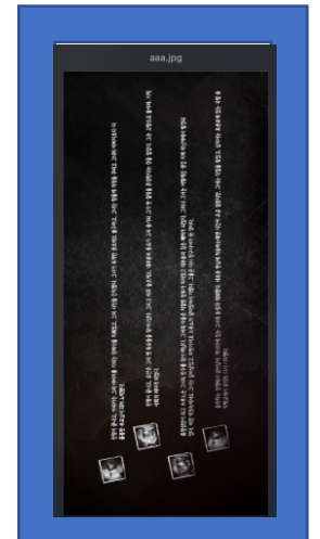
창으로 출력되는 변환된 이미지